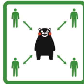
くっつかないモン #KeepDistance